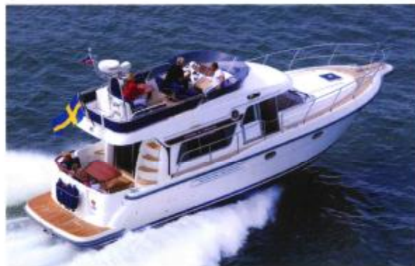
STOREBRO 410 COMMANDER