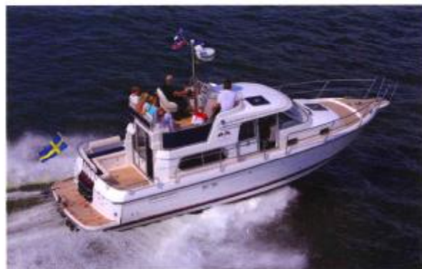
NIMBUS 340 COMMANDER

bcm boots-center münster münster · neustadt · berlin