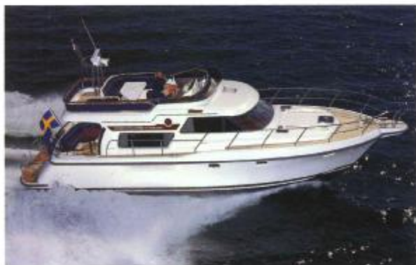
STOREBRO 475 COMMANDER