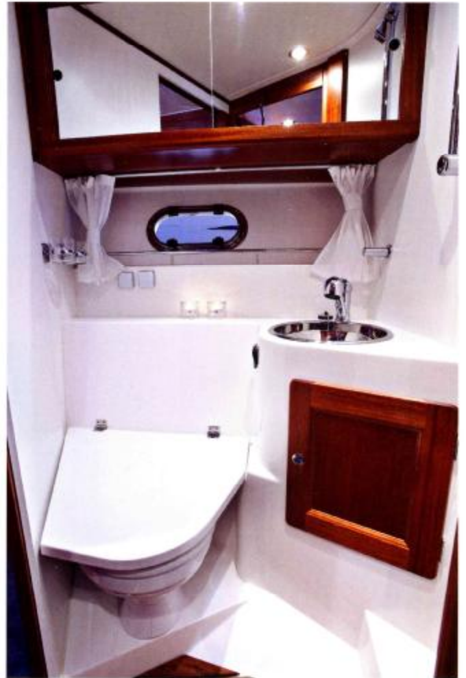
Backbord WC mit integrierter Dusche in 3-Kabinenversion