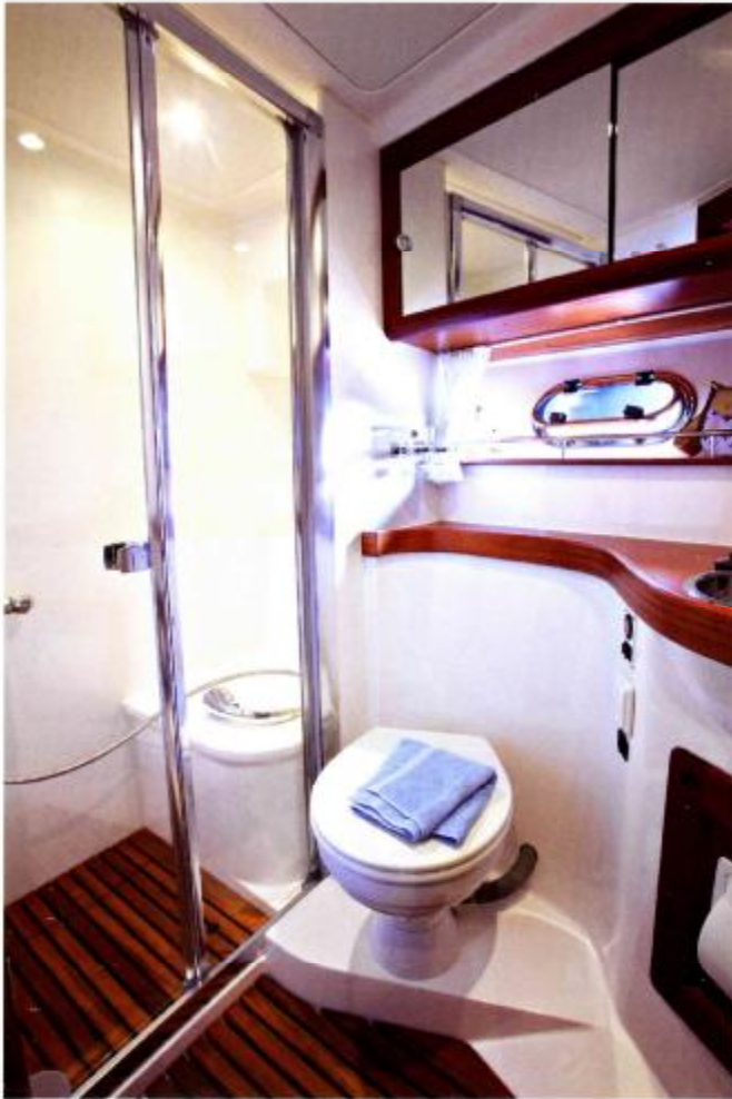
Backbord WC mit separate Dusche für Eigenerkabinen in 2-Kabinenversion