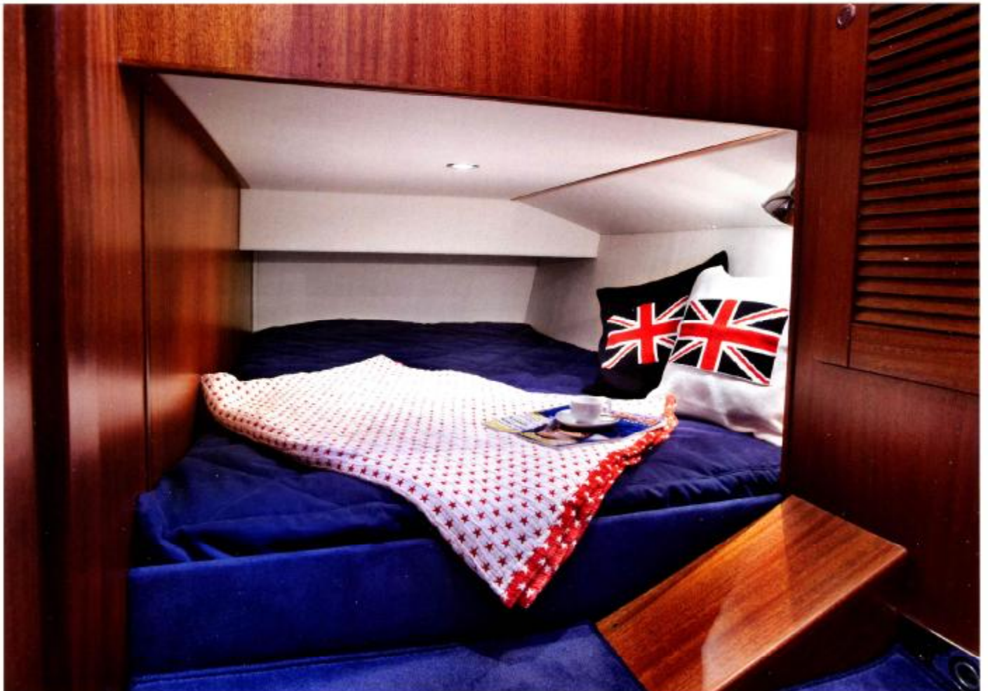
Extra Gästekabine in 3-Kabinenversion