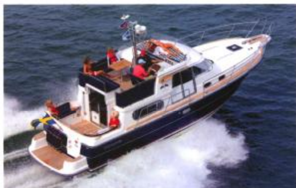
NIMBUS 380 COMMANDER