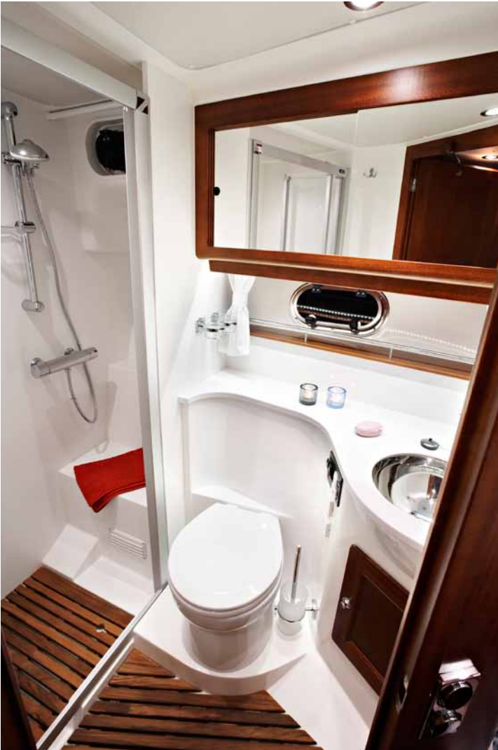
THE SPACIOUS MAIN CABIN WITH DIRECT ACCESS TO TOILET AND SHOWER DIE GERÄUMIGE HAUPTKABINE MIT DIREKTEM ZUGANG ZU TOILETTE UND SEPARATER DUSCHE