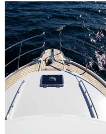
PANORAMIC VIEW IN LUXURIOUS COMFORT PANORAMABLICK IN LUXURIÖSEM KOMFORT