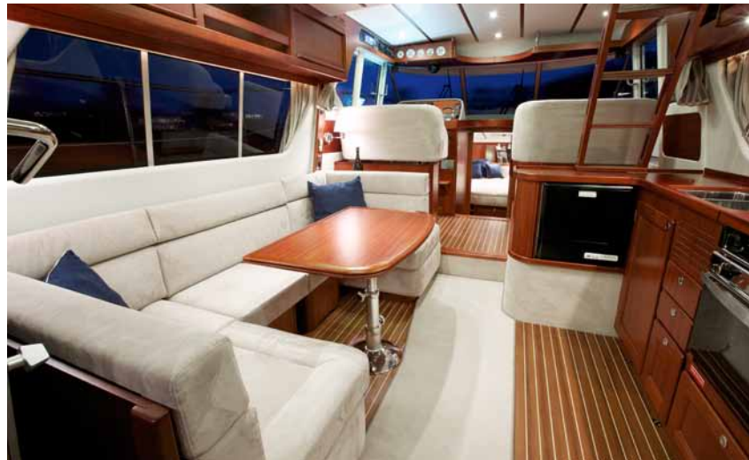
ELEGANT AND TIMELESS INTERIOR DESIGN ELEGANTE UND ZEITLOSE INNENAUSSTATTUNG