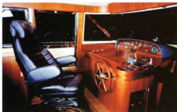
Steuerstand Der aufblasbare Stuhl und die übersichtliche Instrumentierung zählen zu den Pluspunkten.

Wenn Storebro mit dem Slogan „true scandinavian“ wirbt, sind damit nicht allein die klaren Linien der Rumpf- und Decksformen gemeint. Echt skandinavisch sind auch die solide Konstruktion und Bau-