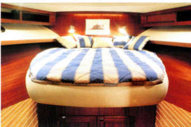
Unter Deck Mit Flybridge-Aufstieg, Küche, Bar und Club-Sofa steht der geräumige Decksalon im Mittelpunkt des Bordlebens. Ruhe findet der Eigner in der Bugkabine.

Die ergonomischen Formen des höhenverstellbaren (hydraulischen) Stuhls können mit Hilfe einer (Hand-) Luftpumpe mehr oder weniger betont werden. Klappbare Armlehnen und eine Fußstütze bieten nicht erst im Rauwasser zusätzlichen