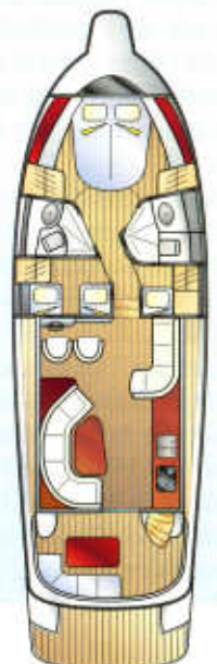
ZEICHNUNG: MARC ANDRE BERGMANN