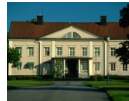
HERRGÅRDEN – HJÄRTAT I STOREBRO BRUKS AB.

I mer än femtio år har vi på Storebro vårdat och utvecklat den skandinaviska båtbyggartraditionen. Ett arv vi förvaltar med både hängivenhet och stolthet. Samtidigt som vi med åren förfinat vårt hantverk har vi även satsat på att använda oss av den nya teknikens många möjligheter. Vi är nämligen övertygade om att riktigt bra kvalitet bygger på både nytänkande och att man är trogen sina ideal.