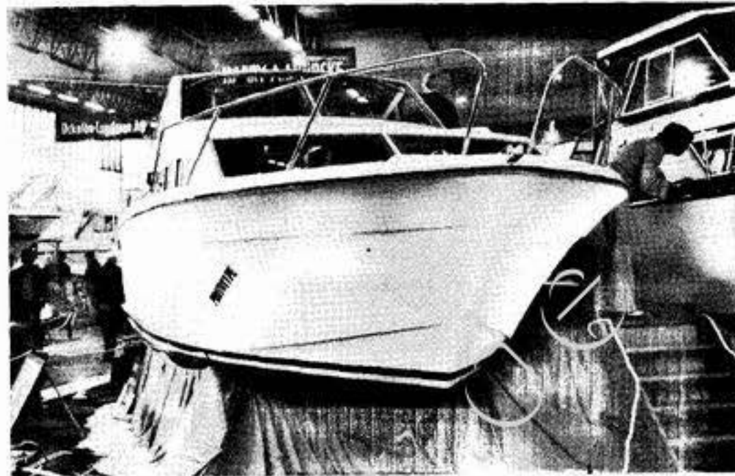
Adler 31: Perfekteste Type unter den Ausstellungsprotos.

Kanal, nach Helgoland oder fürs Ostseerevier.