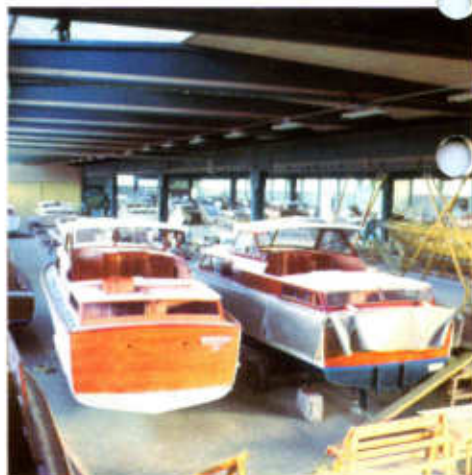
MONTERINGSHALLEN I STOREBRO